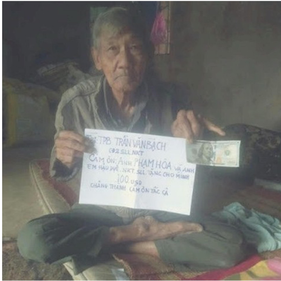
TPB/NKT Trần Văn Bạch Chiến Đoàn 2/SLL